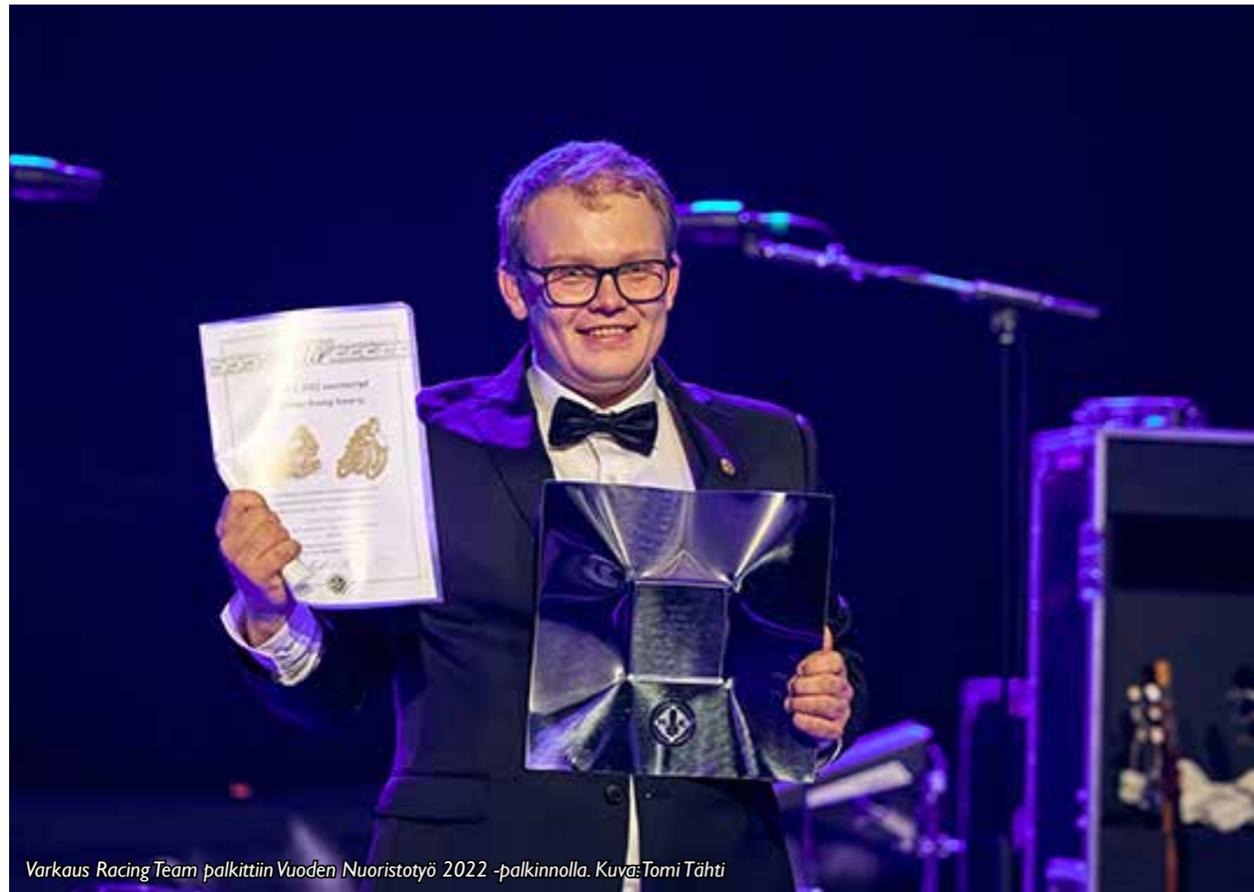
Varkaus Racing Team palkittiin Vuoden Nuoristotyö 2022 -palkinnolla.