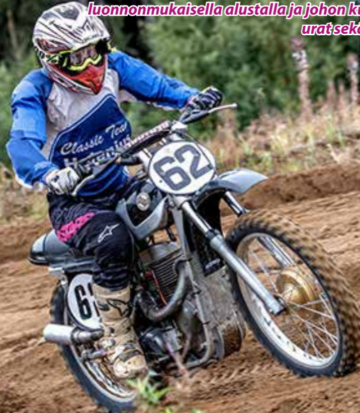
Vuonna 2022 Suomessa ajettiin viisi Classic Motocross -kilpailua.

Classic Motocross on Classic-moottoripyörillä suljetulla kilpailualueella ajettava laji, jossa kisataan luonnonmukaisella alustalla ja johon kuuluvat hyppyrit, urat sekä ylä- ja alamäet