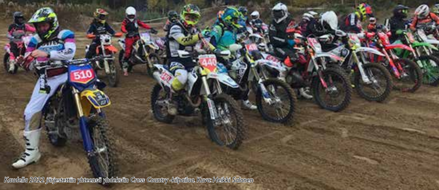
Kaudella 2022 järjestettiin yhteensä yhdeksän Cross Country -kilpailua.

Cross Country on maastossa ajettava pitkäkestoinen reittikestävyyskilpailu, joka on pääpiirteissään Motocrossin ja Enduron yhdistelmä.