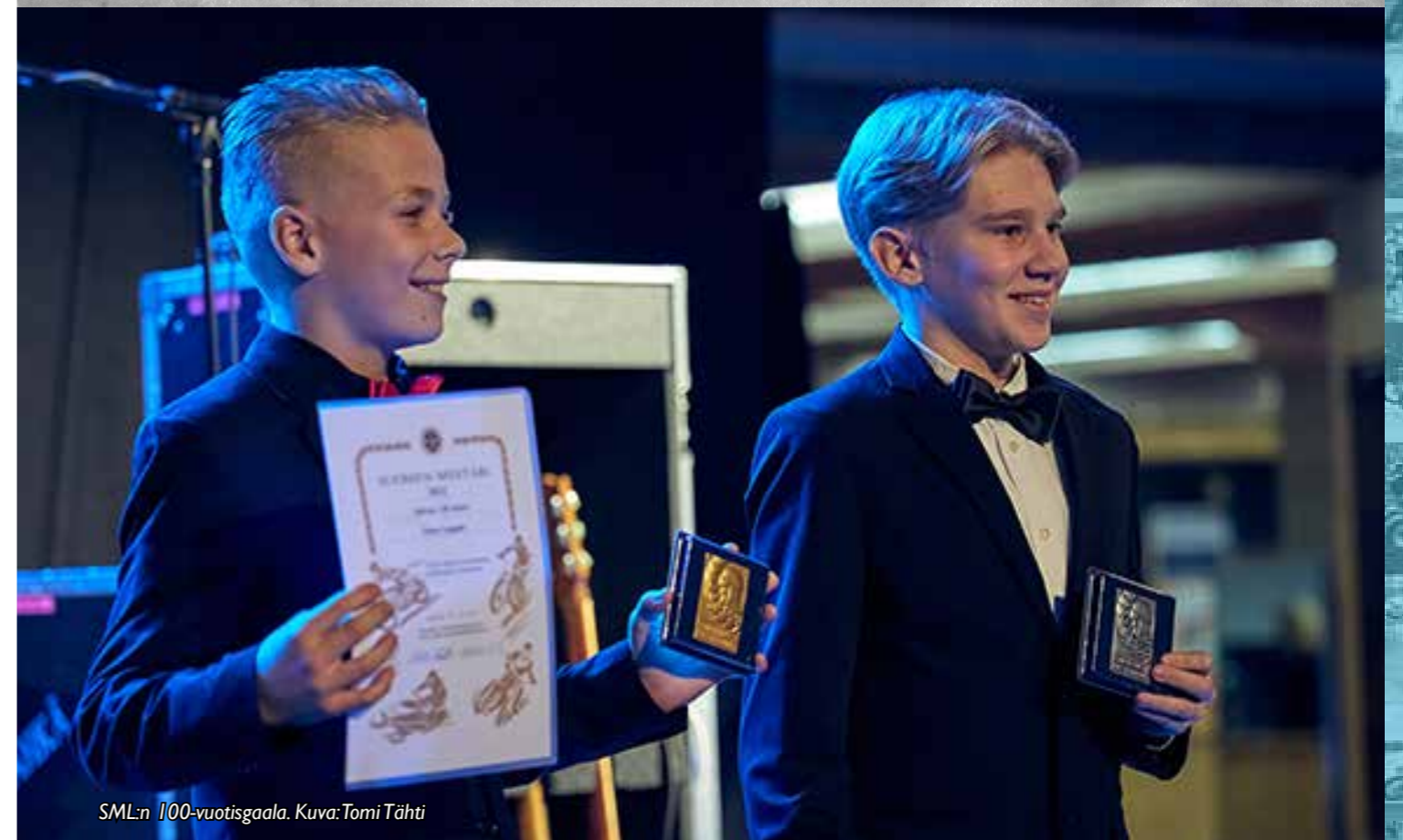
SML:n 100-vuotisgaala.