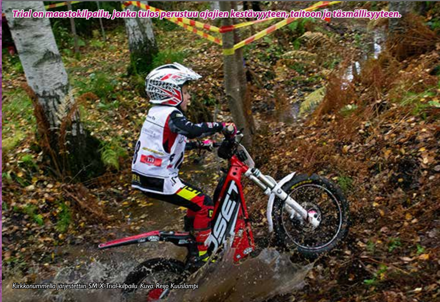
Kirkkonummella järjestettiin SM X-Trial-kilpailu.

Trial on maastokilpailu, jonka tulos perustuu ajajien kestävyteen, taitoon ja täsmällisyyteen.