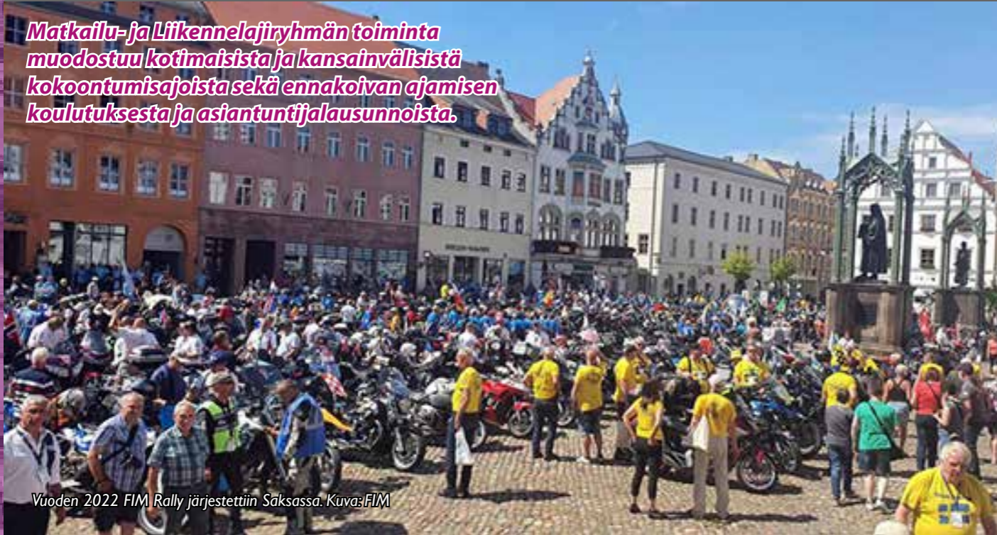
Vuoden 2022 FIM Rally järjestettiin Saksassa.

Matkailu- ja Liikennelajiryhmän toiminta muodostuu kotimaisista ja kansainvälisistä kokoumisajoista sekä ennakoivan ajamisen koulutuksesta ja asiantuntijalausunnoista.