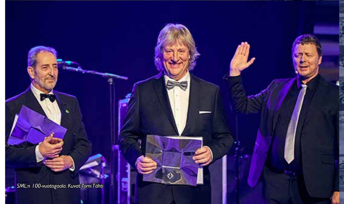
SML:n 100-vuotisgala.