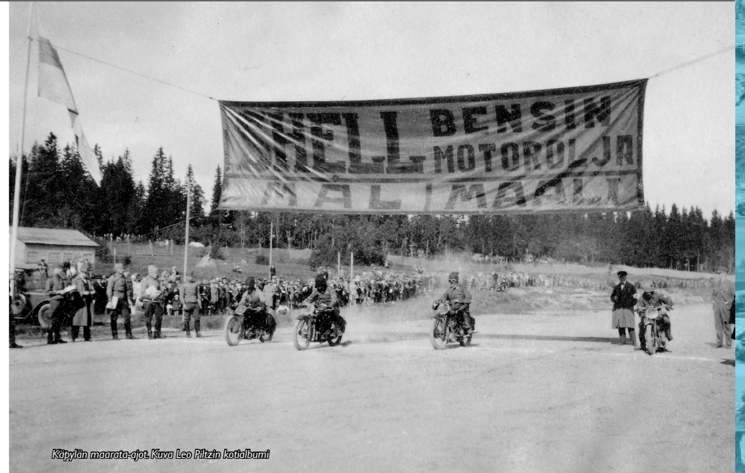
Käpylän maarata-ajot.