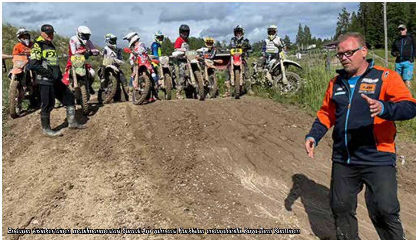
Enduron viisinkertainen maailmanmestari Samuli Aro valmensi Karkkilan enduroleirillä.