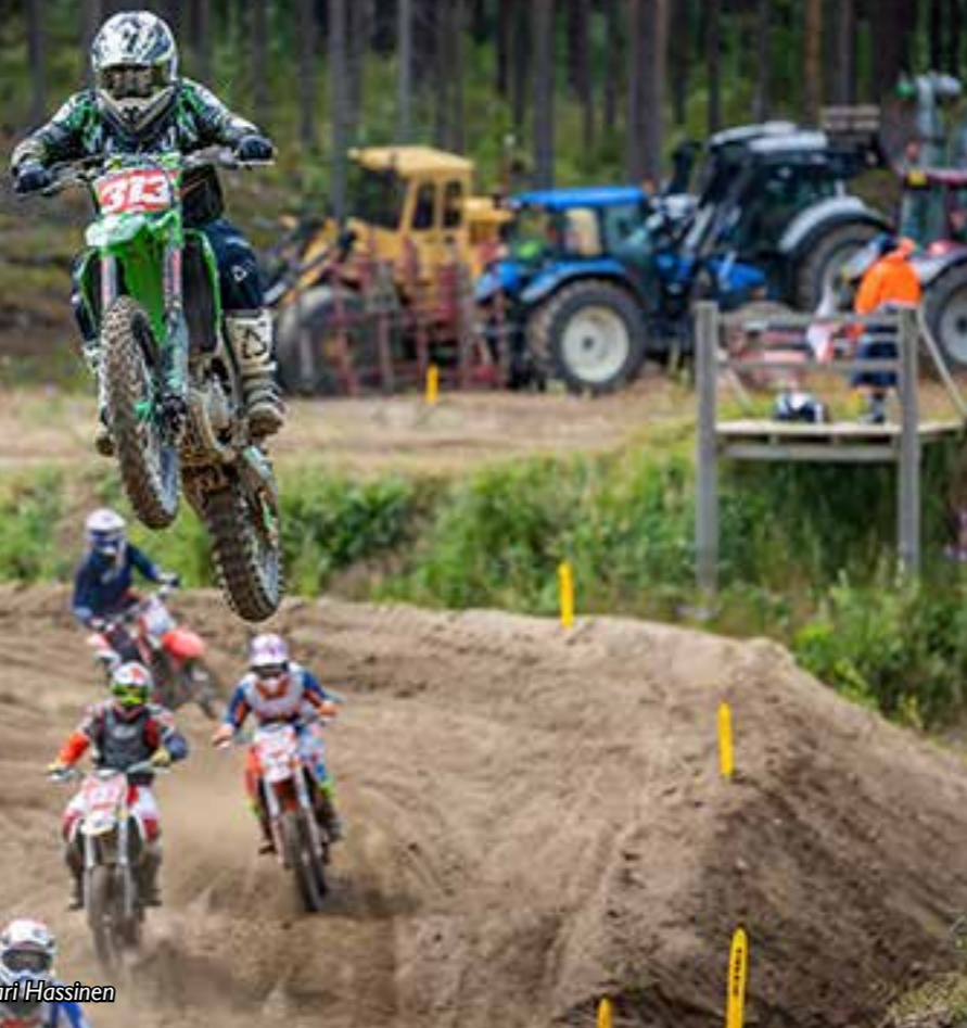
Motocrossin harrastajamäärät nousivat vuonna 2022.

Motocross on suljetulla kilpailualueella ajettava laji, jossa kisataan luonnonmukaisella alustalla ja johon kuuluvat hyppyrit, urat sekä ylä- ja alamäet.