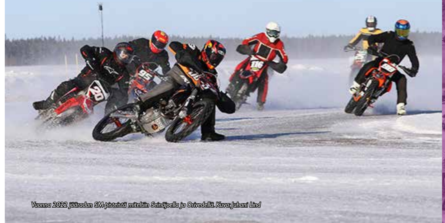
Vuonna 2022 jääradan SM-pisteistä miteltiin Seinäjoella ja Orivedellä. Kuva: Juhani Lind

Jäärataa ajetaan suljetulla radalla motocross-moottoripyöriin perustuvilla ja erikoisnastoitetuilla renkailla varustetuilla ajokeilla. Lajille ominainen piirre on, että lähtöviivalla kohtaavat eri moottoripyörälajien edustajat.