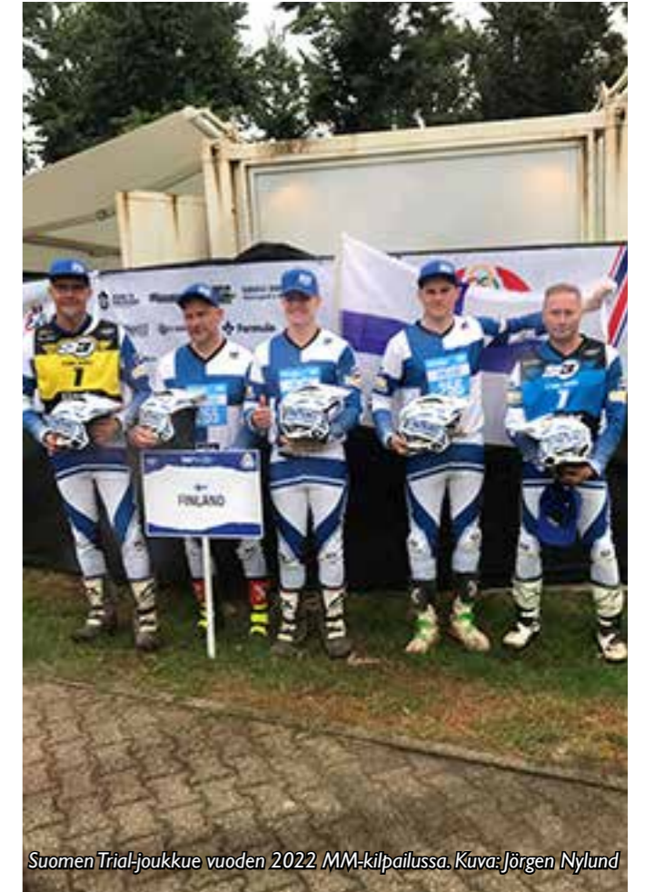
Suomen Trial-joukkue vuoden 2022 MM-kilpailussa.

Valmennustapahtumat on saatu koronan jälkeen taas käyntiin ja osanotto tapahtumissa on ollut erittäin hyvä.