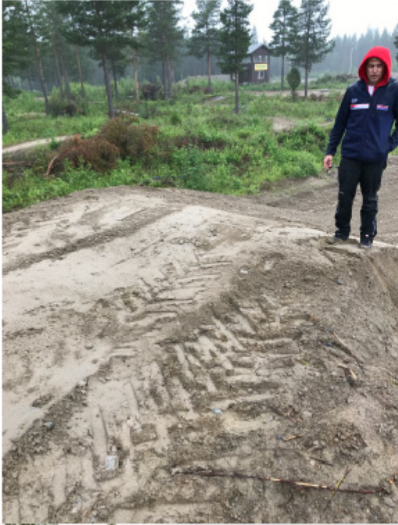
Kuva 1. Hypyn levennys Kuva 2. Toinen alamäki pois Kuva 3. Hypyn vierestä puut pois