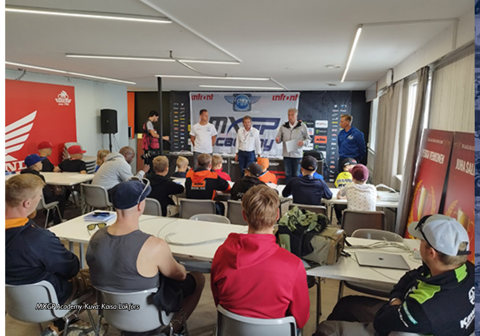
MXGP Academy.