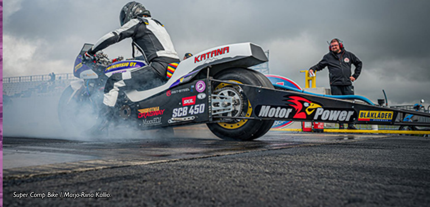
Super Comp Bike / Marjo-Riina Kallio.

Drag Racing on moottoripyörien kiihdytyskilpailulaji, jota ajetaan muulta liikenteeltä suljetulla asfalttiradalla.