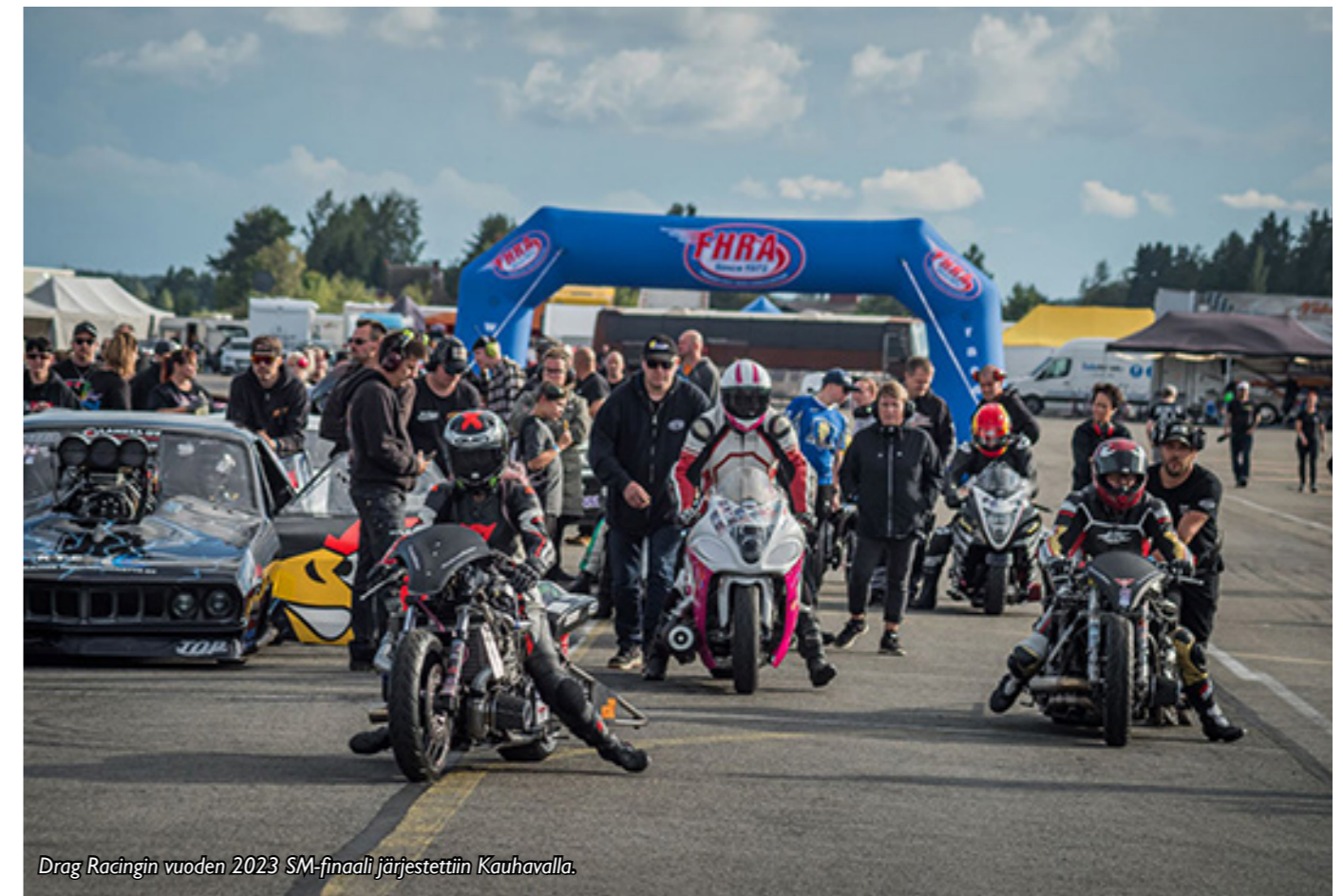
Drag Racingin vuoden 2023 SM-finaali järjestettiin Kauhavalla.