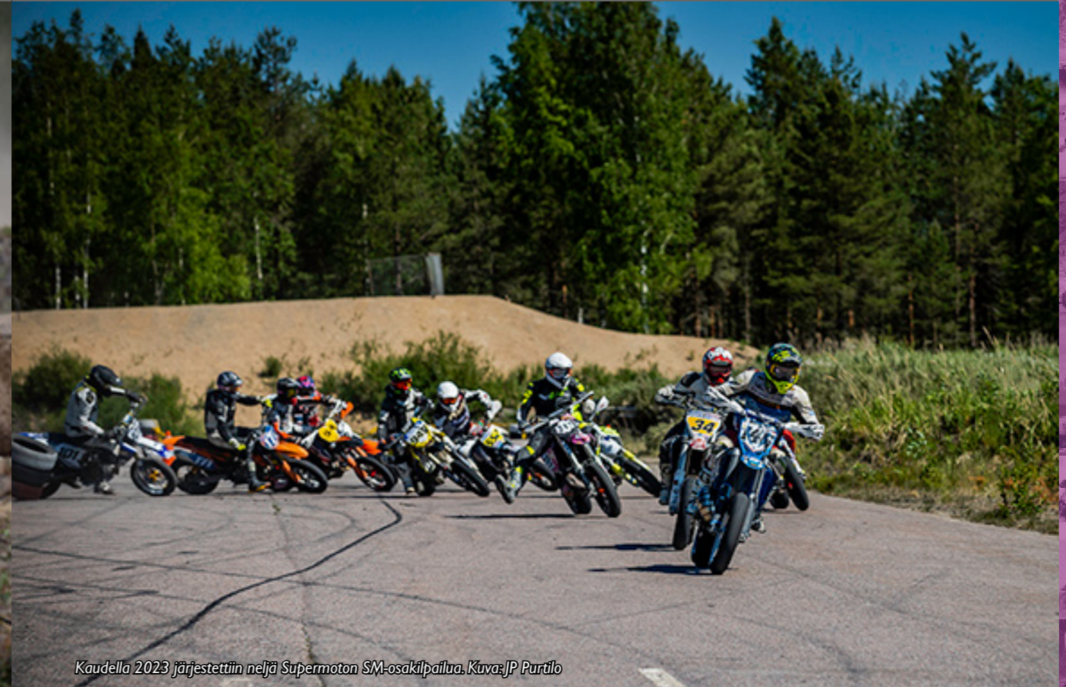
Kaudella 2023 järjestettiin neljä Supermoton SM-osakilpailua.

Classic Motocross -toiminnan tarkoituksena on edistää ja ylläpitää vanhojen motocross-kilpamoottoripyörien harrastusta ja kunnostusta sekä luoda edellytyksiä niillä ajamiseen ja kilpailemiseen.