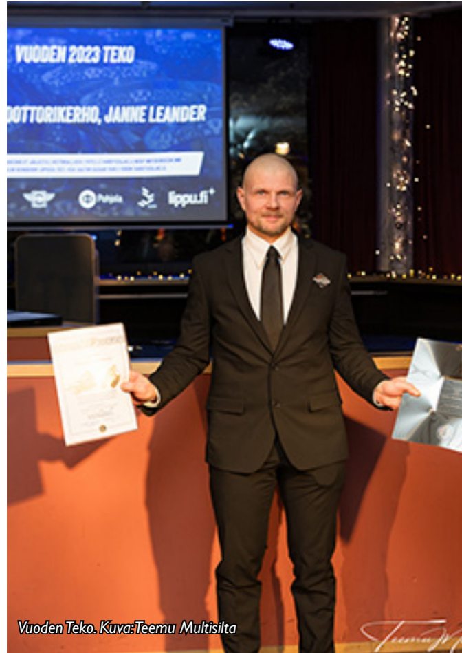
Vuoden Tekö.