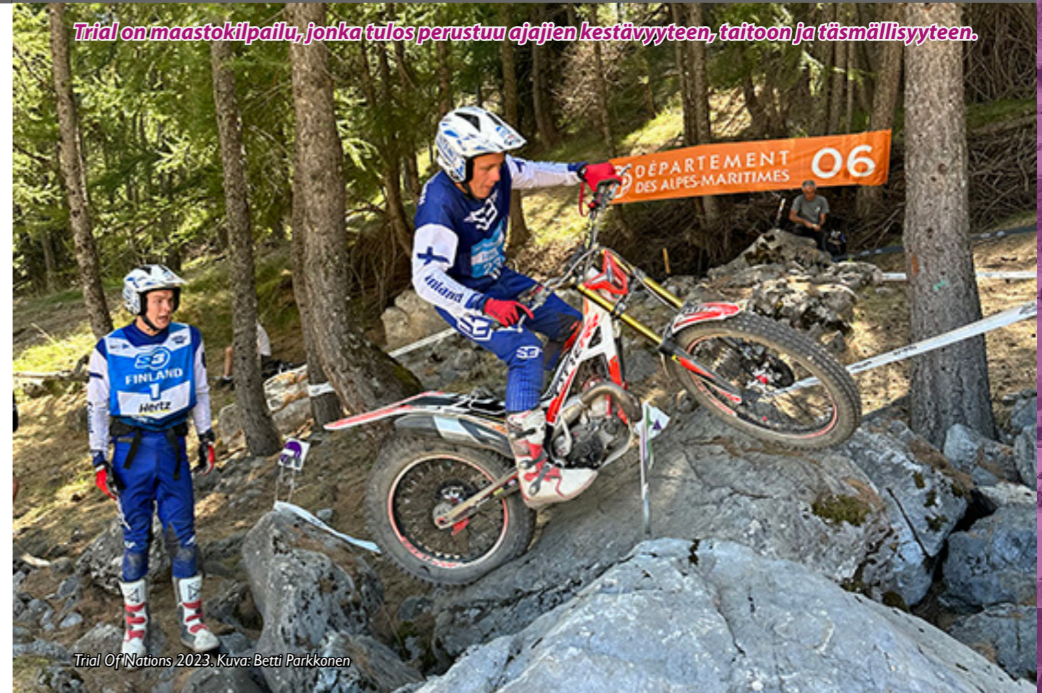
Triäl Of Nations 2023.

Triäl on maastokilpailu, jonka tulos perustuu ajajien kestävyyteen, taitoon ja täsmällisyyteen.