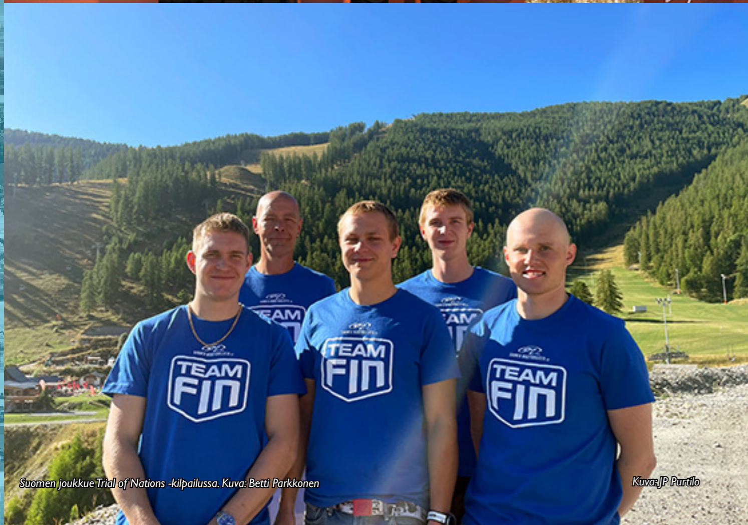
Suomen joukkue Trial of Nations -kilpailussa.

20.-21.05. West Coast Racing ry 18.-20.08. Helsinki Racing Club ry 16.-18.06. Motopark Racing Club ry 01.-03.09. West Coast Racing ry