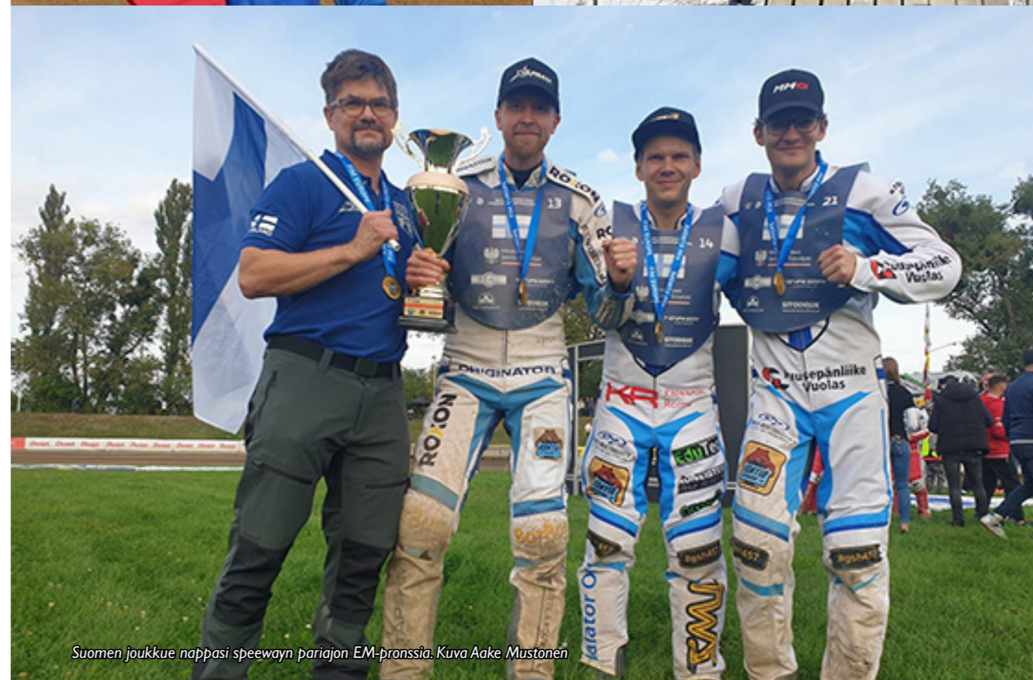
Suomen joukkue nappasi speewayn pariajon EM-pronssia.