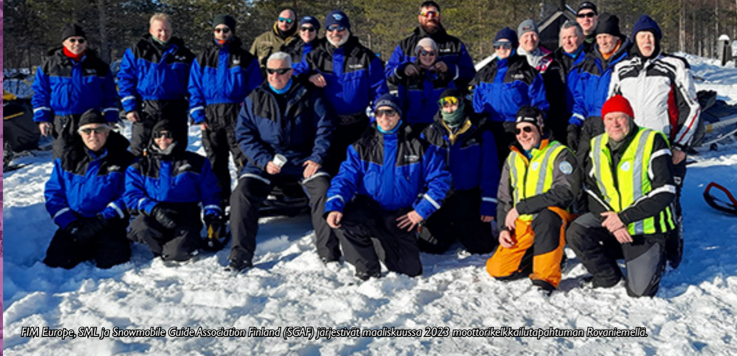
FIM Europe, SML ja Snowmobile Guide Association Finland (SGAF) järjestivät maaliskuussa 2023 moottorikelkkailutapahtuman Rovaniemellä.

MK-matkailuryhmä tukee kelkkailua harrastuksena sekä vaikuttaa moottorikelkkailuun liittyvän lainsäädännön laatimiseen, seuraa kaavoitusta alueellisesti ja on aktiivisesti yhteydessä valtakunnan päättäjiin päämäärien saavuttamiseksi.