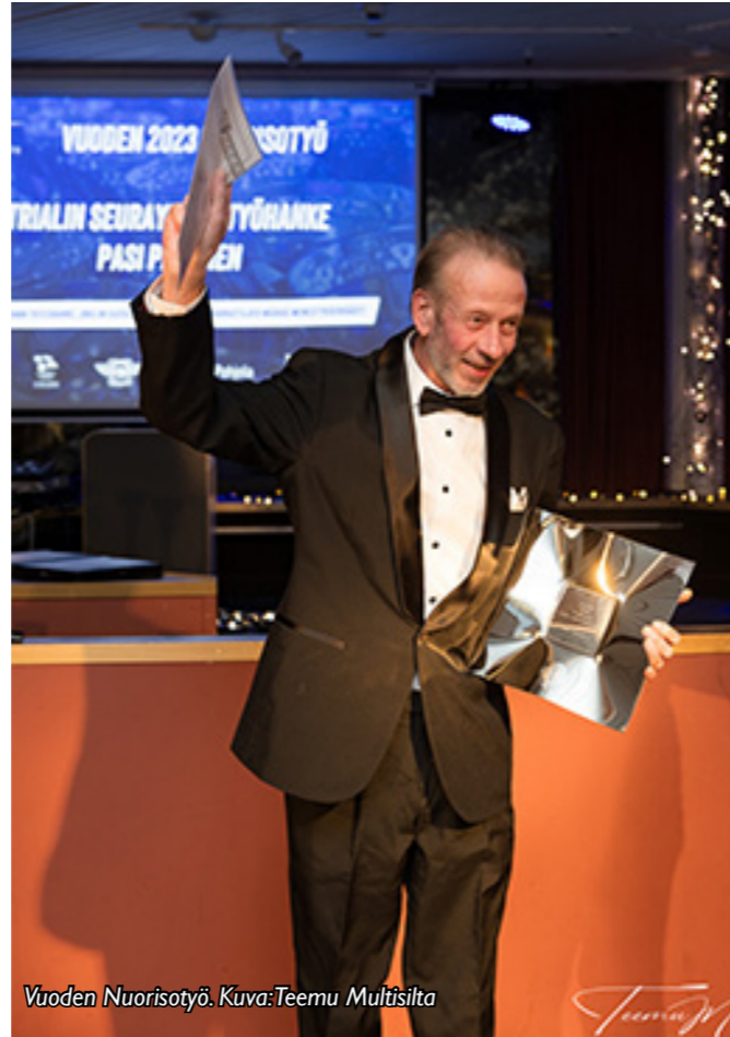
Vuoden Nuorisotyö.