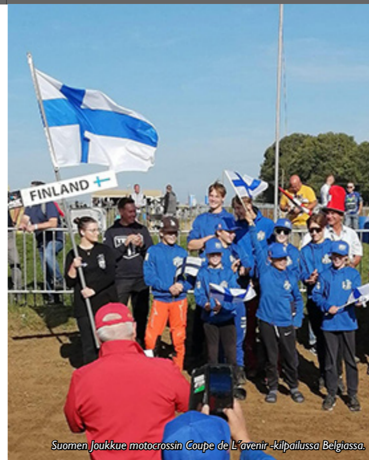
Suomen Joukkue motocrossin Coupe de L'avenir -kilpailussa Belgiassa.