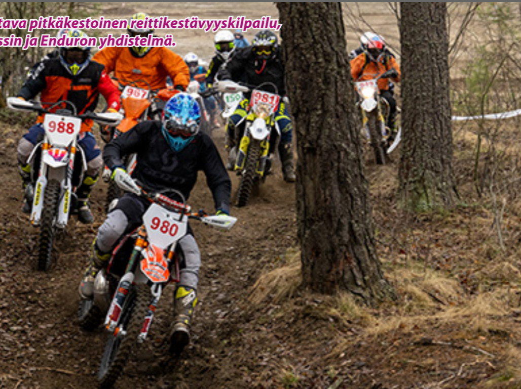
Panssari CC.

Cross Country on maastossa ajettava pitkäkestoinen reittikestävyyskilpailu, joka on pääpiirteissään Motocrossin ja Enduron yhdistelmä.