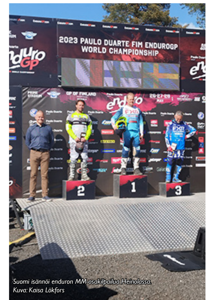
Suomi isännöi enduron MM-osakilpailua Heinolassa.